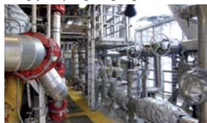
Heidrun prosjektet til Statoil er bare et av mange prosjekter hvor vi har levert en total mengdemålingspakke.