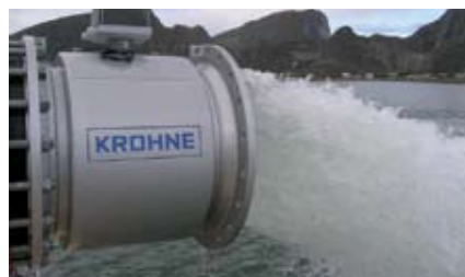
Lensing av havnebassenget på Værøy. 2 pumpeaggregater fra Intec Pumper leverer 4000 m 3 /h gjennom OPTIFLUX 2010 DN500.

Dette industrisegmentet har i den senere tid utviklet seg med rekordfart. Fra enkle til krevende og kompliserte prosesser. Økte krav til optimalisering gir større krav til måleutstyr. KROHNE har tatt med seg all prosesserfaring fra mange aktive år i industrien og utviklet løsninger for vann og avløp. Dette har resultert i optimaliserte målere til formålet. Alt fra kjemikaliedosering, TS-måling, analyse og feltapplikasjoner som sonevann- og pumpestasjonsmålinger. Her kan nevnes OPTIMASS coriolis som TS-måler, WATERFLUX vannmåler og analyseinstrumenter. Kjentetegnet på KROHNE i denne bransjen er kombinasjonen industriell kvalitet, service og igangkjøringsbistand i kombinasjon med konkurransedyktige priser.