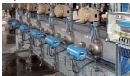
Kjemikaliedosering med 12 stk. OPTIMASS 3050 DN4 corialis massemlere på Noretyl på Rafnes.