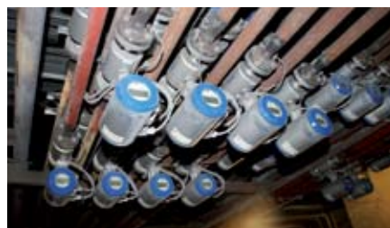
Overvåkning av kjølevannskretser på Elkem Thamshavn med UFM3030 DN25 ultralyd mengdemålere.

Gjennom mer enn 30 år har vi opparbeidet oss en uvurderlig kompetanse på prosessene og de måletekniske kravene innen Olje & Gassnæringen, spesielt når det gjelder kompetanse på materialkrav som stilles for å oppnå en sikker prosess. Vi har lært oss å produsere det næringen vil ha, og ikke bare fabrikk standardprodukter. Vi forholder oss til Norsok standard og sluttbruker standard der det er påberopt. Gjennom vår lange tid i bransjen har vi opparbeidet oss en enorm base med produkter på den norske sokkelen. Vi er markedsledende på både prosessmålinger og fiscale målinger. Man skal lete lenge for å finne en installasjon uten et instrument fra KROHNE.