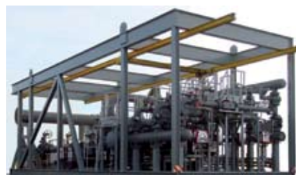
Målestasjon for kjøp og salg til Skarv, BP. Altosonic V femstråle ultralyd mengdemålere er valgt for nøyaktighet og langtid stabilitet.