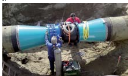
Vestfold interkommunale vannverk graver ned en OPTIFLUX 2300 DN700 elektromagnetisk mengdemåler.